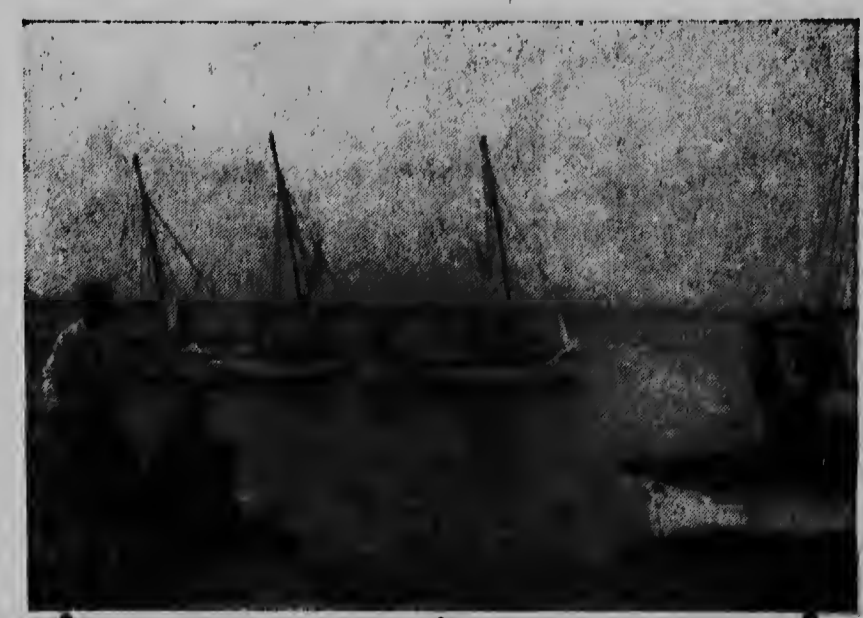
Even na het startseln voor de zelfwedstrijden voor de grote schepen op Zaterdag J. Vilegensvlug worden de zeilen gehesen.